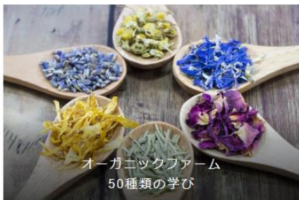
オーガニックファーム 50種類の学び