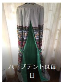
ハーブテントは毎日