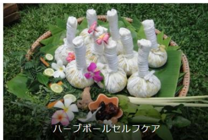
ハーブボールセルフケア